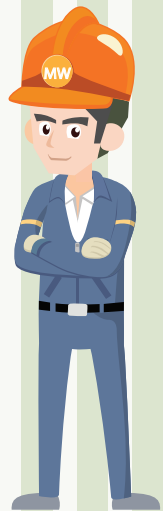
Minor Works Contractor

在正常情況下，雨水透過大廈天台或外牆滲入所引致的滲水問題，或供水喉管滲漏引致天花或牆身滲水，並不屬於公眾衛生的滋擾問題，故不可引用《公眾衛生及市政條例》（第132章）第12條採取執法行動。