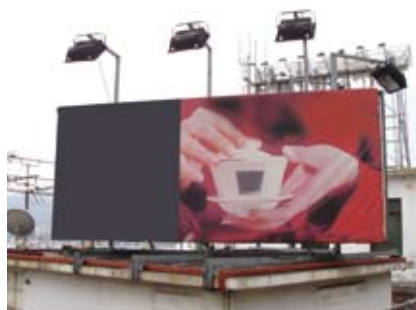
於建築物屋頂的招牌