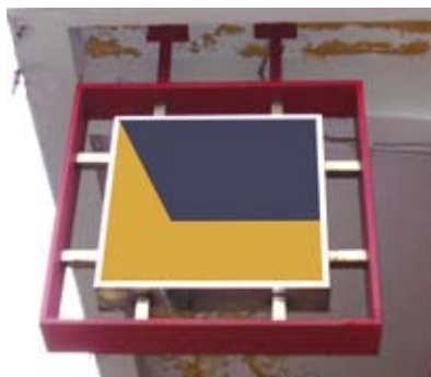
豎設於懸臂式平板的露台或 簷篷上/底部之下的招牌