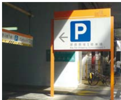
豎設於地面上的戶外招牌