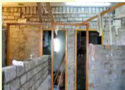
於樓宇單位內豎設用磚建造的非承 重牆、鋪設實心地台以加厚樓板、或 豎設或改動地面以上的排水渠