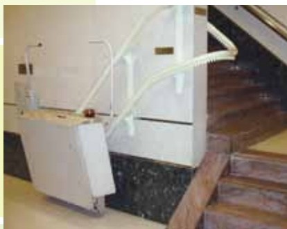
樓梯升降機或升降平台 相關的建築工程