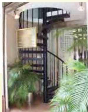
室內樓梯及平板開鑿