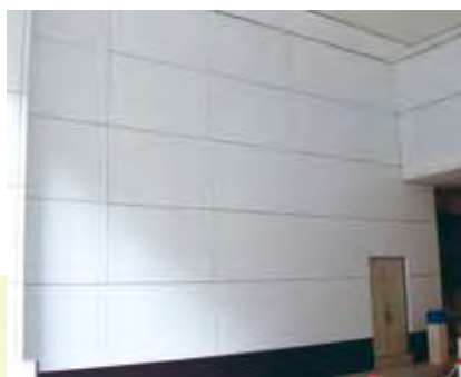
於建築物內牆壁上 以金屬暗銷及嵌固件固定的鑲板