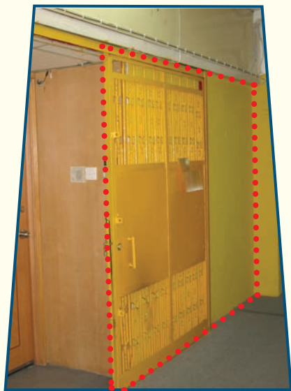
個別單位入口而無阻礙走火通道的 金屬鐵閘