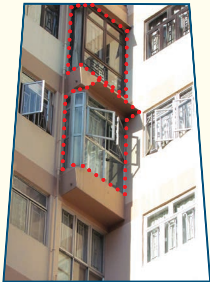
原有批准花槽上加建圍封窗戶