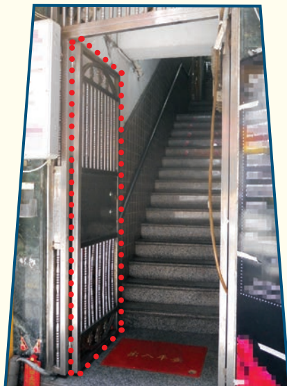
阻礙走火通道的鐵閘