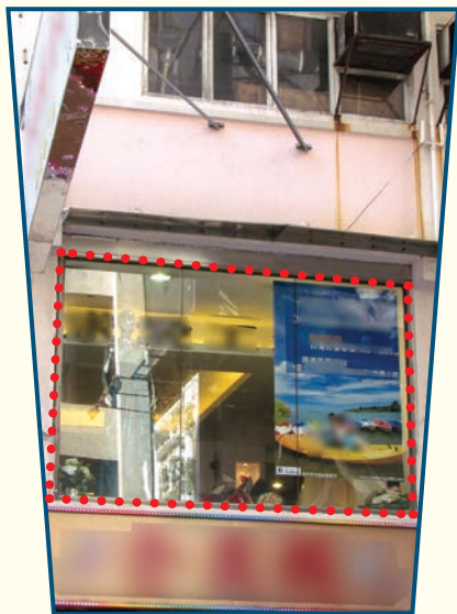
違規的大型玻璃嵌板