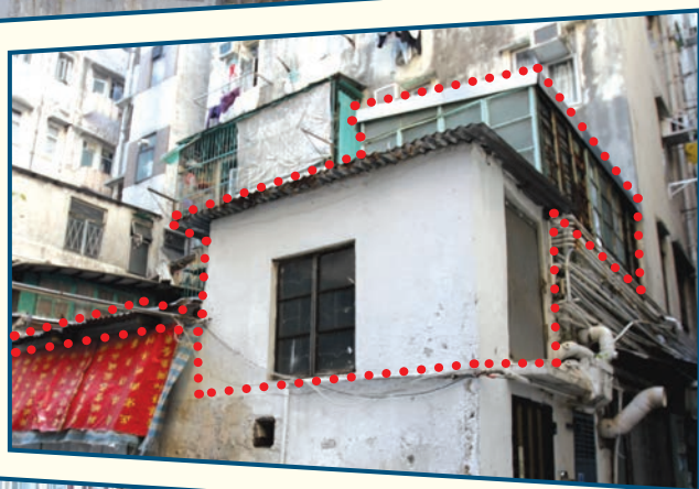
地下天井的僭建物