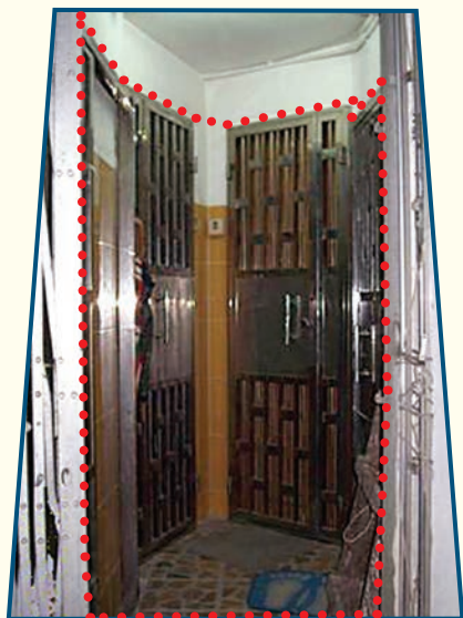
違規的分間單位工程