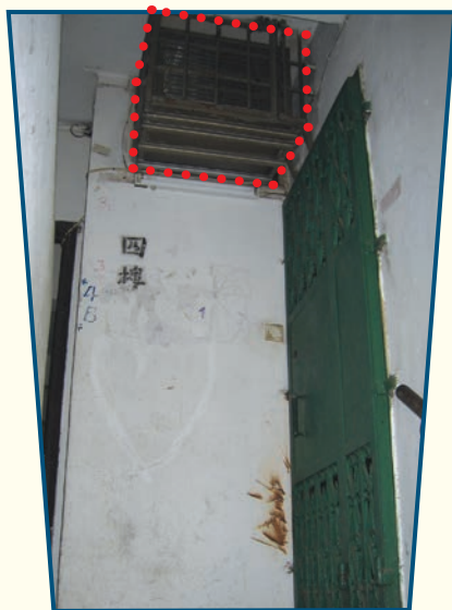
樓梯的圍牆開鑿洞口