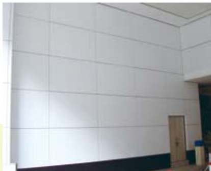
於建築物內牆壁上 以金屬暗銷及嵌固件固定的鑲板