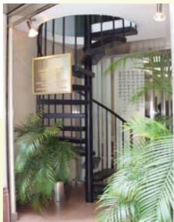
室內樓梯及平板開鑿