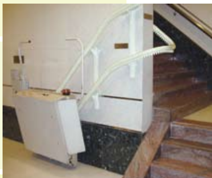
樓梯升降機或升降平台 相關的建築工程