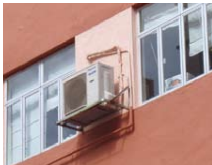
支承空調機及 相關空氣管道的金屬支架